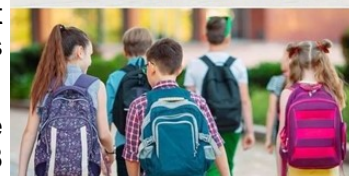
La rue des Nations