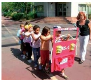
Inventer et construire une chenille pédibus