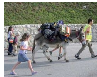
Accompagner l'âne qui porte les cartables