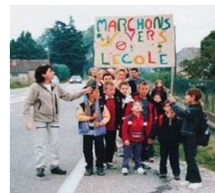
Fêter ensemble marchons vers l'école