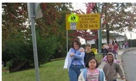
Colombie Britannique Canada