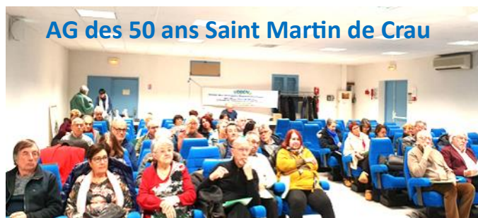
AG des 50 ans Saint Martin de Crau