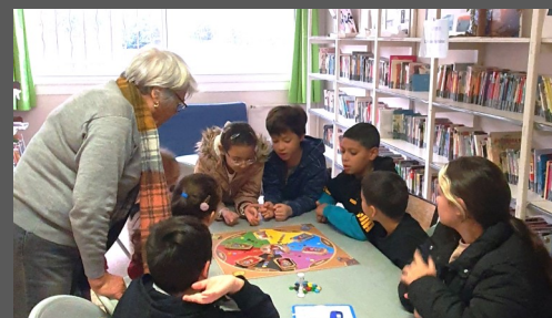
Des élèves de CM découvrent le jeu Laïque'Cité

Depuis de nombreuses années des Délégués Départementaux de l'Éducation Nationale (DDEN) d'Aix en Provence de Saint Martin de Crau, de Châteaurenard, de Marseille... accompagnent les initiatives pédagogiques d'enseignants pour explorer le thème de la laïcité, notamment dans le cadre de la journée nationale de la laïcité.