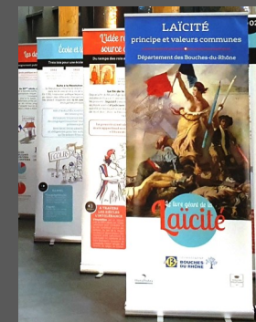
L'exposition du Livre Géant de la laïcité du CD13 installée en Mairie des Pennes-Mirabeau

Les DDEN qui veillent à ce que ce principe, au fondement du Service public de l'Éducation, reste un principe de liberté et de respect d'autrui, encouragent et facilitent ces démarches. Nous vous présentons ci-après des outils utilisés dans des écoles du premier degré.